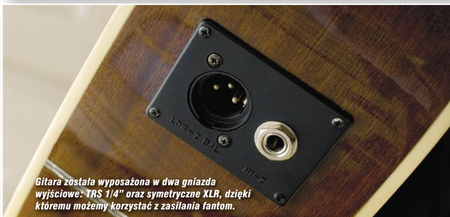
Gitara została wyposażona w dwa gniazda wyjściowe: TRS 1/4" oraz symetryczne XLR, dzięki któremu możemy korzystać z zasilania fantom.