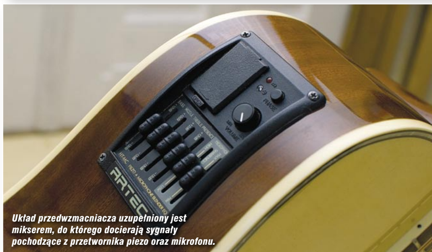
Układ przedwzmacniacza uzupełniony jest mikserem, do którego docierają sygnały pochodzące z przetwornika piezo oraz mikrofonu.