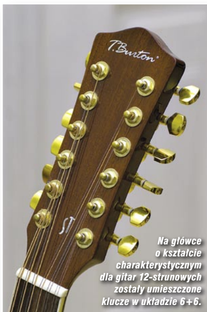
Na główce o kształcie charakterystycznym dla gitar 12-strunowych zostały umieszczone klucze w układzie 6+6.

D zięki dwutorowemu (piezo i mikrofon) systemowi nagłośnienia Foresthill dysponuje bardzo bogatą paletą brzmieniową. Jak na instrument stworzony raczej do roli akompaniującej, potrafi brzmieć zadziwiająco różnorodnie