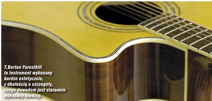
T.Burton Foresthill to instrument wykonany bardzo estetycznie, z dbałością o szczegóły, czego dowodem jest starannie wykonany binding.